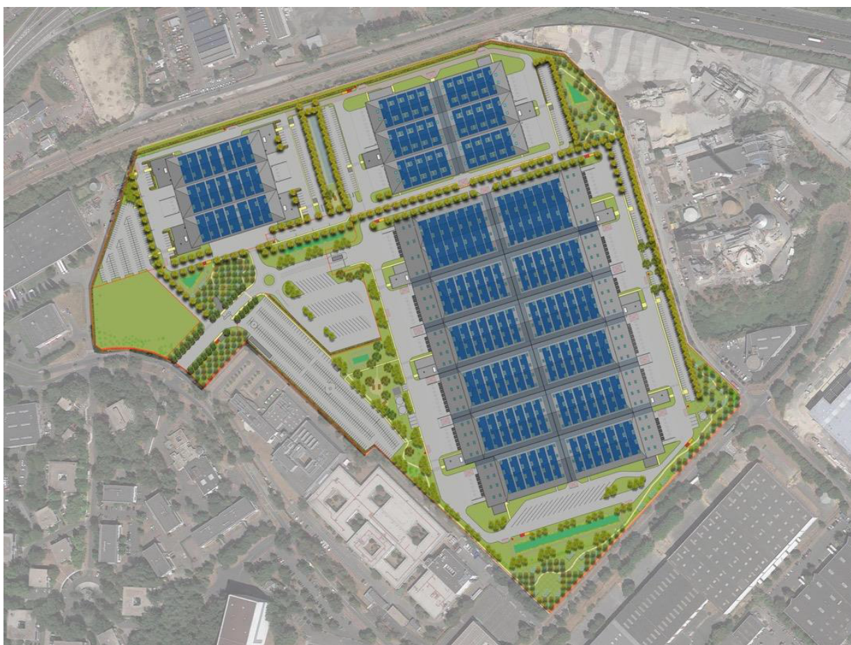
Illustration du projet d'aménagement paysager

La réalisation d'entrepôts destinés au stockage de produits manufacturés correspond à une demande des acteurs économiques locaux et nationaux. De tels entrepôts garantissent le stockage de marchandises dans des conditions de sécurité renforcées.